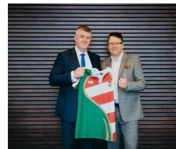
Támogatói szerződés aláírása a PWC Magyarország elnökével 2017. december 19.