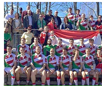
Finnország-Magyarország: 5-37 2017. május 6.