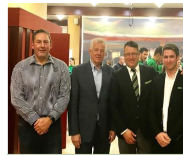
Nemzetközi konferencia 2017. december 14.