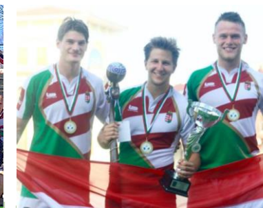
Conference 1 7's EB 2018. július 1-2.